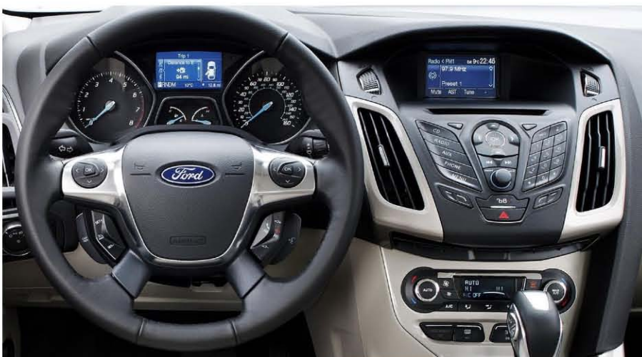
Advanced Focus/C-Max Display